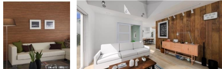
ウッド調の壁紙★ かなりリアルな感じに仕上がっているので本物？と勘違いするかも？木目は高級感も出ますし、一部貼るだけで一気にセンスUPです！