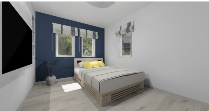
無地ネイビーの壁紙★ 白い壁に落ち着いたネイビーが マッチします。茶系の家具とも 相性バッチリ★