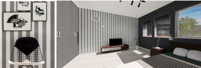
ストライプの壁紙★ 男性にも人気の商品。 子供部屋に選ぶ方も多いです！

最近、息子がドラえもんみたいに押入れで寝たい！と言いだし旦那と押入れDIYしたばかりの尾野です。可愛く完成し、毎日押入れベッドで寝てます(笑) もうすぐ春。春らしくお部屋も明るく、ちょっとイメージを変えてみたい！そんなときは壁の一面だけ違うクロスを貼る。それだけでガラリとお部屋の雰囲気が変わってしまいます。今では壁紙に糊が付いているものも売っていて簡単に自分で貼れちゃうんです！！こんな感じのアクセントクロスはいかがですか？ 当社でも人気のクロスはこちら→→→